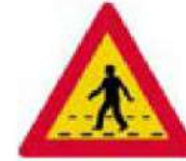
(Κ-15) Κίνδυνος λόγω διάβασης πεζών.