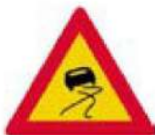
(Κ-12) Ολισθηρό οδόστρωμα.