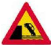
(Κ-8) Η οδός οδηγεί σε αποβάθρα ή όχθη ποταμού.