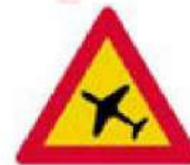
(Κ-22) Κίνδυνος λόγω χαμηλής πτήσης προσγειούμενων ή απογειούμενων αεροσκαφών.