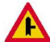
(Κ-28β) Διακλάδωση με κάθετη οδό δεξιά, επί της οποίας οι κινούμενοι οφείλουν να παραχωρήσουν προτεραιότητα.