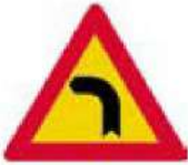
(Κ-1α) Επικίνδυνη αριστερή στροφή.