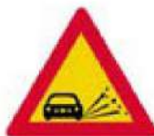
(Κ-13) Επικίνδυνη εκτίναξη χαλίκων, (ασύνδετο αμμοχάλικο).