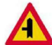
(Κ-28α) Διακλάδωση με κάθετη οδό αριστερά, επί της οποίας οι κινούμενοι οφείλουν να παραχωρήσουν προτεραιότητα.