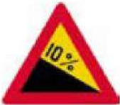
(Κ-3) Επικίνδυνη κατωφέρεια (με κλίση όπως η αναγραφόμενη στην Πινακίδα).