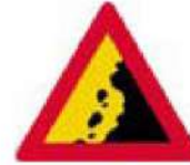
(Κ-14) Κίνδυνος από πτώση βράχων και από την παρουσία τους στο οδόστρωμα.