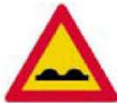
(Κ-9) Επικίνδυνα ανώμαλο οδόστρωμα σε κακή κατάσταση, με λάκκους κ.λπ.