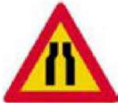
(Κ-5) Επικίνδυνη στένωση οδοστρώματος και στις δύο πλευρές.