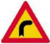
(Κ-1β) Επικίνδυνη δεξιά στροφή.