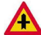
(Κ-27) Διασταύρωση με οδό, επί της οποίας οι κινούμενοι οφείλουν να παραχωρήσουν προτεραιότητα.