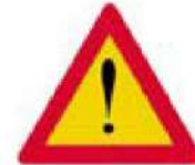
(Κ-25) Προσοχή άλλοι κίνδυνοι (μη δηλούμενοι στις πινακίδες Κ-1 έως Κ-24)