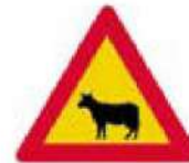
(Κ-18) Κίνδυνος από διέλευση οικόσιτων ζώων.