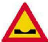
(Κ-11) Επικίνδυνο κάθετο ρείθρο (αυλάκι) ή απότομη κοίλη αλλαγή της κατά μήκος κλίσης της οδού.