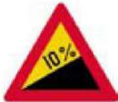
(Κ-4) Επικίνδυνη ανωφέρεια (με κλίση όπως η αναγραφόμενη στην Πινακίδα).