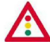
(Κ-21) Προσοχή, κόμβος ή θέση όπου η κυκλοφορία ρυθμίζεται με τριχρώμη φωτεινή σηματοδότηση..