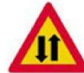
(Κ-24) Προαναγγελία διπλής κυκλοφορίας.