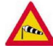
(Κ-23) Κίνδυνος λόγω συχνού ισχυρού ανέμου (όπως δείχνει η κατεύθυνση του ανεμοούριου).