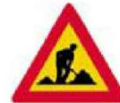
(Κ-20) Κίνδυνος λόγω εκτελούμενων εργασιών στην οδό.