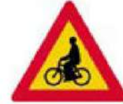
(Κ-17) Κίνδυνος συχνής εισόδου ή διάβασης ποδηλατιστών.