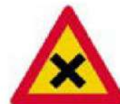
(Κ-26) Προσοχή, διασταύρωση όπου ισχύει η από δεξιά προτεραιότητα.