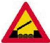
(Κ-7) Κινητή γέφυρα.