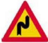
(Κ-2β) Επικίνδυνες δύο αντίρροπες ή διαδοχικές (συνεχείς) στροφές - η πρώτη δεξιά.