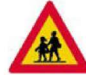
(Κ-16) Κίνδυνος λόγω συχνής κίνησης παιδιών. (σχολεία, γήπεδα κ.λπ.)