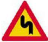
(Κ-2α) Επικίνδυνες δύο αντίρροπες ή διαδοχικές (συνεχείς) στροφές - η πρώτη αριστερά.