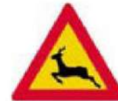
(Κ-19) Κίνδυνος από διέλευση άγριων ζώων.