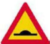
(Κ-10) Επικίνδυνα υπερυψωμένο οδόστρωμα ή απότομη κυρτή αλλαγή κατά μήκος κλίσης της οδού.